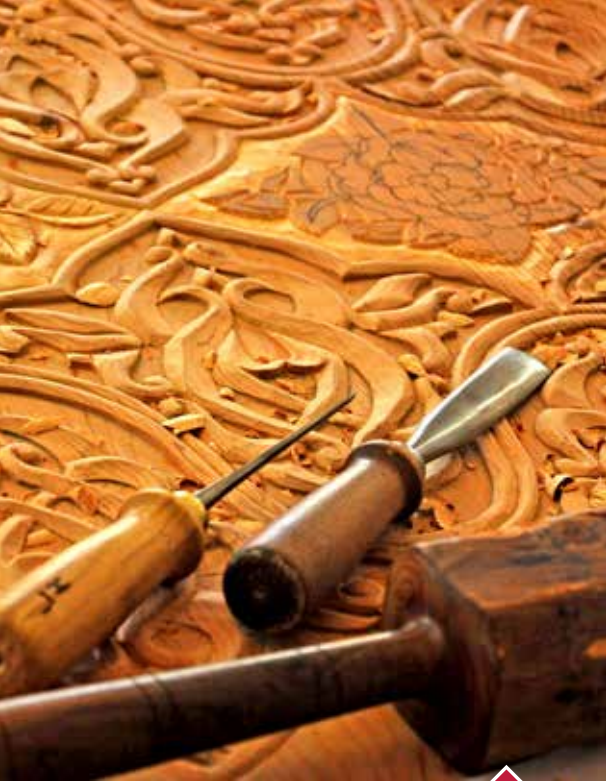
AHŞAP OYMA SANATI

Geleneksel Türk El Sanatlarından olan ahşap oymacılığı Isparta'da geçmişte yapılmakta olup zaman içerisinde unutulmaya yüz tutmuş sanatlardandır. 2010 yılından itibaren Isparta Belediyesi bünyesinde faaliyet gösteren ahşap oyma atölyesinde usta-çırak eğitimi şeklinde yetişen sanatkarlar tarafından bu köklü sanat devam ettirilmektedir. Kadim Anadolu coğrafyasında yetişen şimşir, ıhlamur, meşe, ceviz, elma, armut, sedir, gül ağacı, ardıç, kestane, çam gibi ağaçların üzerine oyma, kakma, boyama, künde-kari ve çakma tekniklerle sandıklar, hediyelik kutular, duvar panoları, anıt kapılar, ünlü tabloların replikaları yapılmaktadır. Bezemelerinde yoğun olarak Isparta simgesi haline gelmiş olan gül motifi ayrıca geleneksel Türk süsleme sanatları motiflerinden geometrik ve bitkisel motifler, Selçuklu geçmeleri ve rumiler kullanılmaktadır.