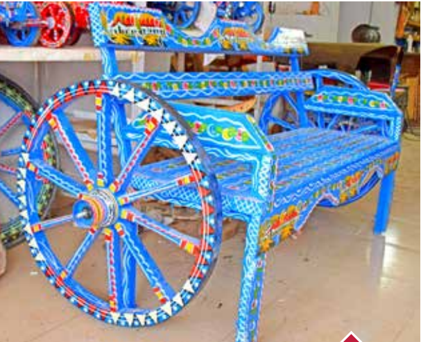
AT ARABASI BANKI