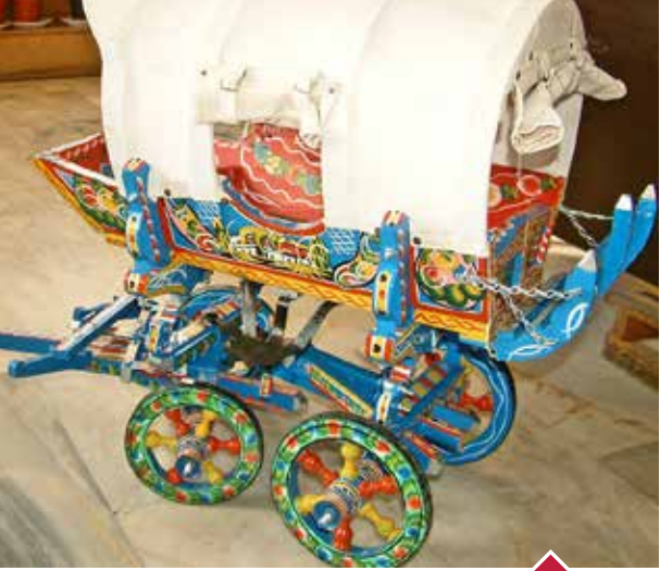
MİNYATÜR AT ARABASI

Yalvaç İlçesi'nde minyatür at arabası yapan tek imalatçı bulunmaktadır. Modern hayat içinde kullanımı giderek kalınan at arabalarının minyatür hale getirilerek hediyelik ve turistik ürüne dönüştürüldüğü ayrıca otel, lokanta, bahçe gibi sivil mimari yapılarda dekoratif bir araç haline geldiği görülmektedir.