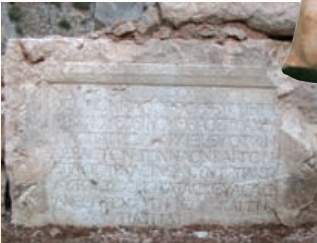
* Kybele ve Eurymedon Kutsal Alanı

Zindan Mağarası önündeki Kutsal Alan, Timbriada Antik Kenti'ne bağlı bir alandır. Mağara civarındaki kazılardan elde edilen bilgilere göre, Erken Hellenistik dönemden itibaren, yazıtların içeriğinden ise MS I.-II. yüzyılda kutsal alanın yapıldığı tespit edilmiştir. Kutsal alan erken dönemlerde açık hava