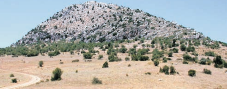
* Timbriada Antik Kenti