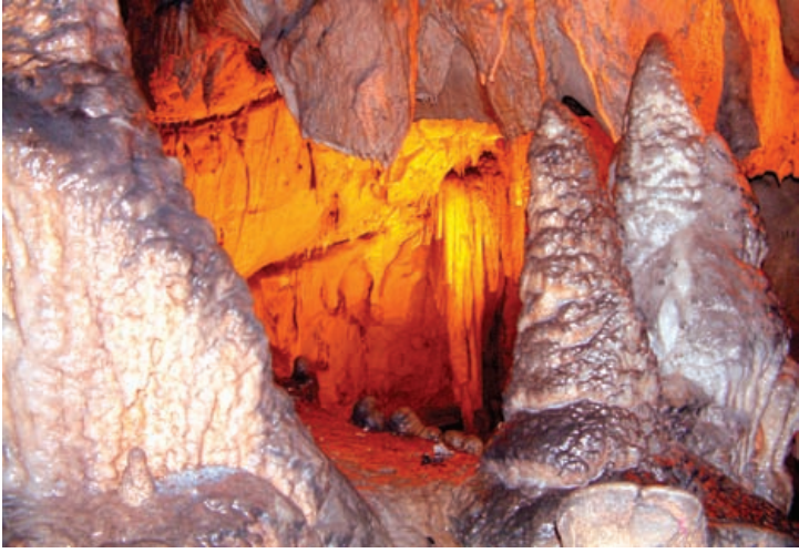
* Zindan Mağarası

Mağarayı gezdikten sonra Aksu'nun soğuk sularında üretilen alabalıklardan yemek isterseniz, Aksu Zindan Mağarası yol ayrımında bulunan lokantaya gidebilirsiniz.