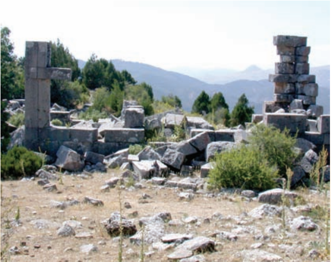
* Tynada Antik Kenti

Terziler Köyü yakınında Asar Tepe Mevkii'nde bulunan Tynada Antik Kenti'nin kesin kuruluş tarihi bilinmemekle birlikte, kent üzerinde Helenistik dönem tapınak ve işlevi belirsiz bina kalıntıları mevcuttur.