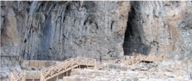
* Zindan Mağarası

Mağara girişinde siyah, beyaz ve kırmızı taş tesseradan yapılmış Eurymedon (Köprü Çayı Tanrısı) başı iki yanında yunus motifi, altta ve üstte kanatlı uçan erkek motifleri olan mozaik bulunmaktadır.